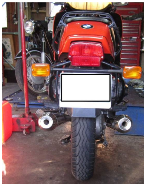
右側にスペーサーを追加