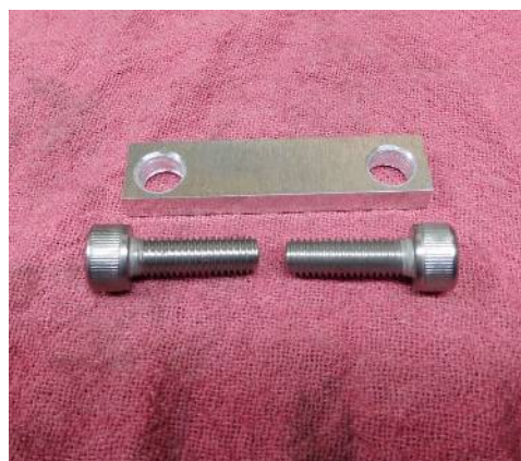
アルミスペーサーとスクリュー