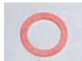
バルカンファイバー製ガスケット