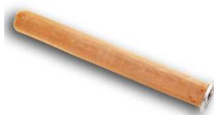
メッシュスクリーン一体型ガスケット