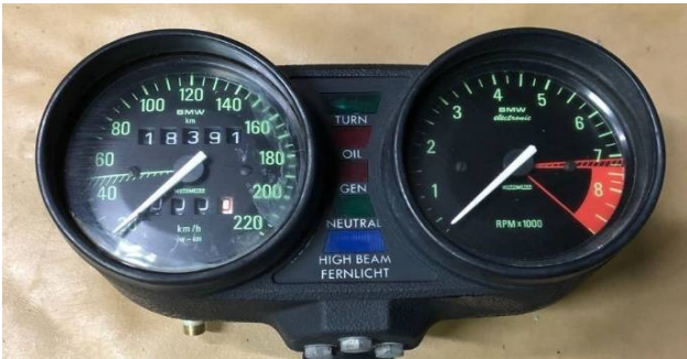
MADE BY MOTOMETER 1973-1995