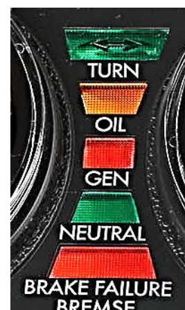
ウインカーS/W左側移行