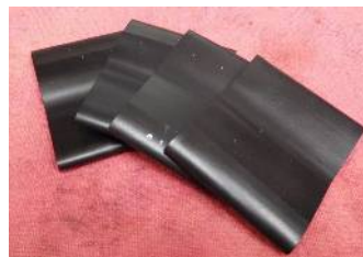
シュリンクチューブ 利尻産に非ず