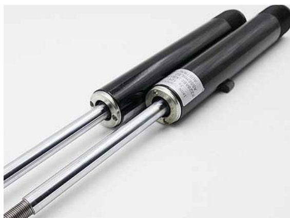
IKON はカバー無しで供給しているようだ

古いパーツリストでは「23」のように 部品設定がありました但し製造工程が変わり 装着できなくなりました。 その後は部品に装着されて供給