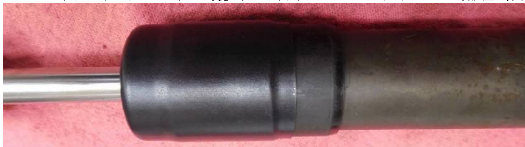
ヒートガンで万遍なく温めるとシワがなくなり綺麗に仕上がります この状態で厚み1.2ミリ ユニット外径32ミリ