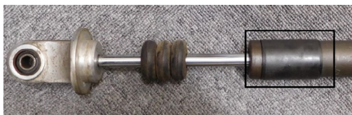
ツライチより3ミリぐらいズラすと綺麗に仕上がります

収縮温度が120度なのでお湯を掛けても収縮しません。ヒートガンで加熱させるかトーチや コンロの遠火で試してください。