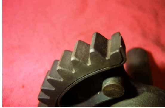
ファーストコンタクト部