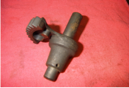
キックセグメントギア全景

アイドルギアと噛み合わないようリーフスプリングを用いた位相合わせの工夫が見られる。 経年車両では構成部品の磨耗により機能が低下しキックペダルが降りないなどの不具合が起きる。